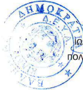
ΙΩΑΝΝΗΣ ΠΑΡΑΓΙΟΣ ΠΟΛΙΤΙΚΟΣ ΜΗΧΑΝΙΚΟΣ