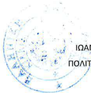
ΙΩΑΝΝΗΣ ΠΑΡΑΓΙΟΣ ΠΟΛΙΤΙΚΟΣ ΜΗΧΑΝΙΚΟΣ