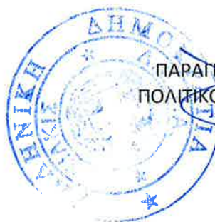
ΠΑΡΑΠΟΣ ΙΩΑΝΝΗΣ ΠΟΛΙΤΙΚΟΣ ΜΗΧΑΝΙΚΟΣ

ΘΕΩΡΗΘΗΚΕ Ο ΠΡΟΪΣΤΑΜΕΝΟΣ Δ/ΝΣΗΣ ΤΕΧΝΙΚΗΣ ΥΠΗΡΕΣΙΑΣ